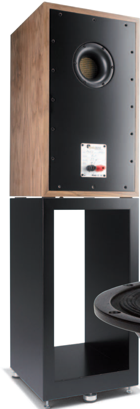
DA PASSEN AUCH LPS REIN: Der ausgefuchst resonanzoptimierte Ständer entstand in Zusammenarbeit mit bFly Audio.

oder Thiel, die dem Ideal sehr nahe kommen. Breitbänder jedoch haben die Zeitrichtigkeit gewissermaßen eingebaut: eine Schwingspule, eine Membran, keine Weiche – da kann phasenmäßig kaum was schiefehen, solange kein bizarr verbogener Frequenzgang das Ergebnis hintenrum wieder zunichte macht.