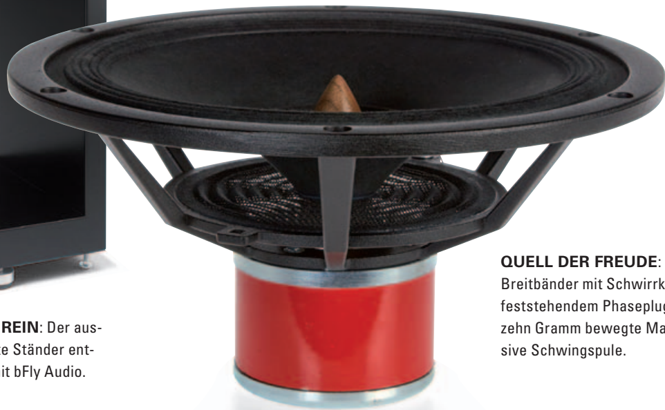
QUELL DER FREUDE: Der Alnico-Breitbänder mit Schwirrkonus und feststehendem Phaseplug hat nur zehn Gramm bewegte Masse – inklusive Schwingspule.

Den Erfolg der Bemühungen kann man am Frequenzgang ablesen, der ohne große Einbrüche bis über 20kHz reicht – mit einem 20er-Breitbänder normalerweise schwer zu schaffen. Wobei auch der